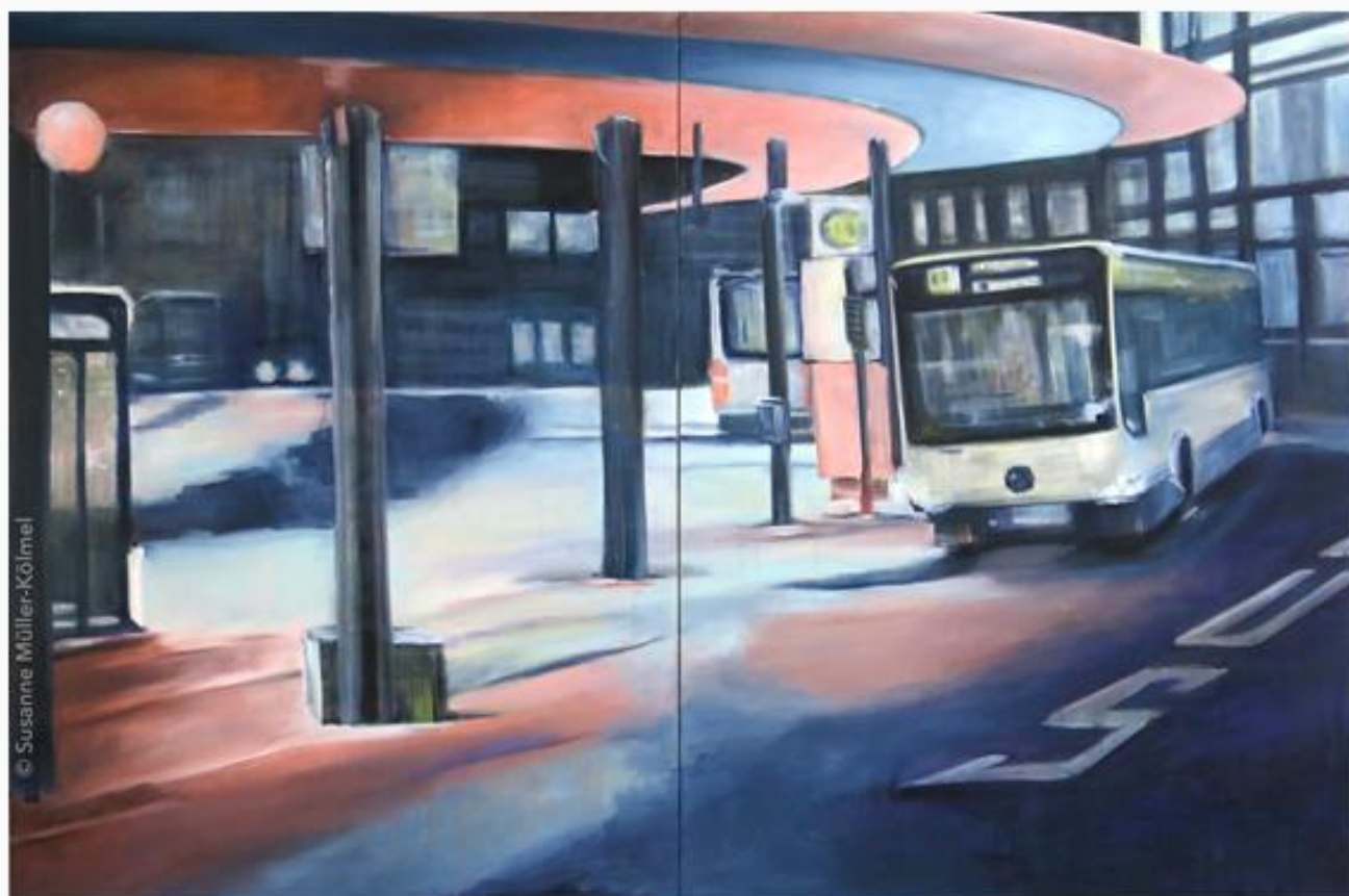
"Hin und weg"

"Wie eine Vorahnung erscheint im Rückblick diese großformatige Leinwandarbeit „hin und weg“ aus dem vergangenen Herbst. Wer hätte damals gedacht, dass heute die öffentlichen Räume (Busbahnhof Solingen) menschenleer sind? Die Faktoren: Zeit-Geschehen, Erinnerung und Zukunft spielen eine wesentliche Rolle."