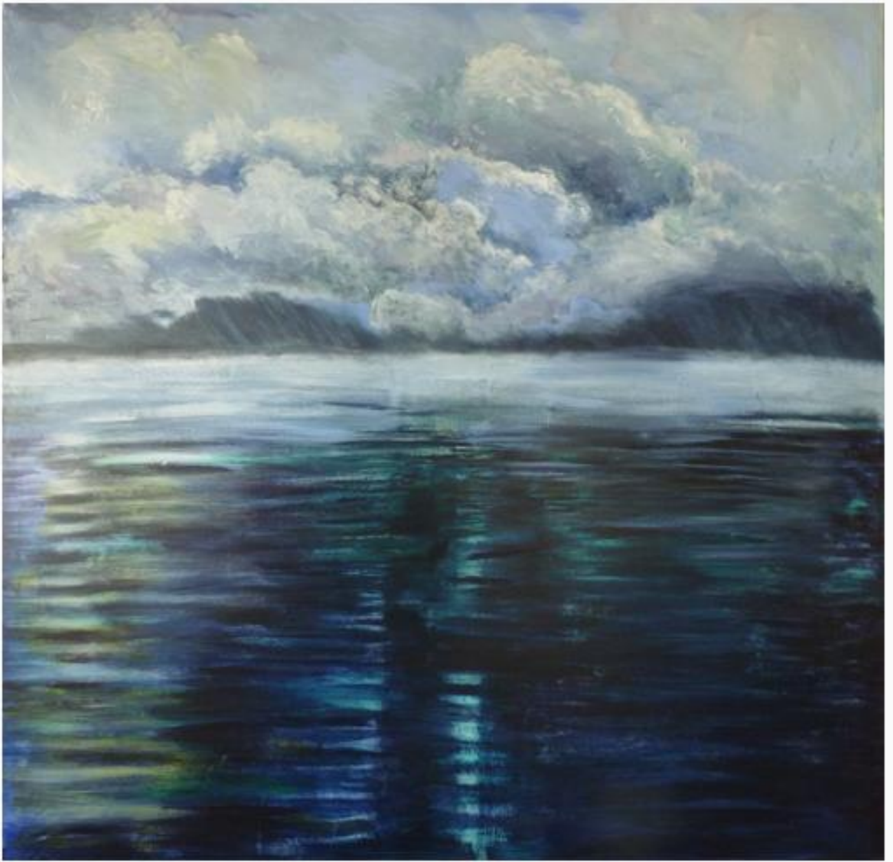
"Meerbild", Acryl auf mit Chinapapier kaschierter Leinwand, 140 x 130 cm, 2017

"Die gezeigte Arbeit entstand zu einem Zyklus „Ruhe und Sturm“. Für mich lag der Reiz in der Erzeugung einer Dramaturgie, einem Kontrast zwischen Stille und Sturm.