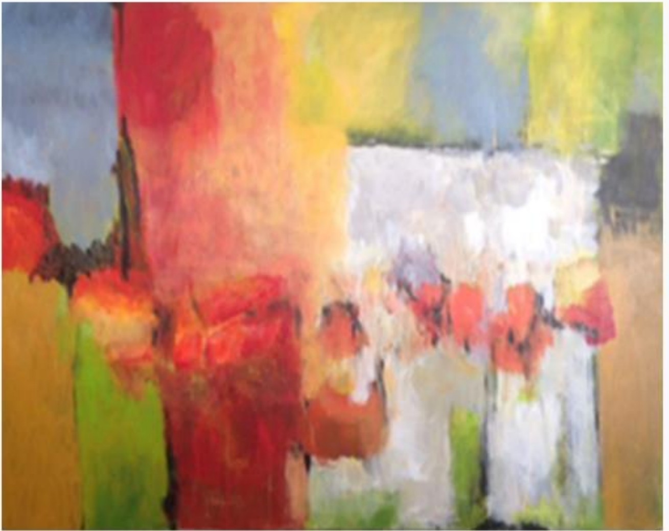
„Zuversicht“, Acryl auf Leinwand, 80 x 100 cm, 2019

"Keine zentrale Komposition, verschiedene Tiefen, vieles ist möglich, Farbigkeit frisch, optimistisch."