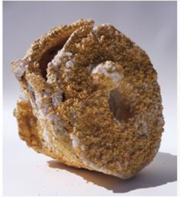
"Safe" und "Golden Star"